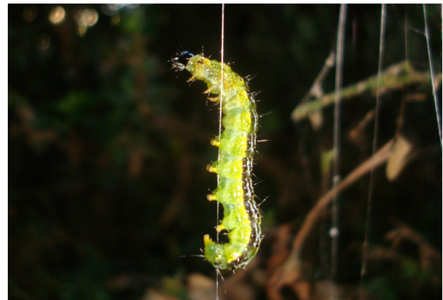
Raupe des Buchsbaumzünslers