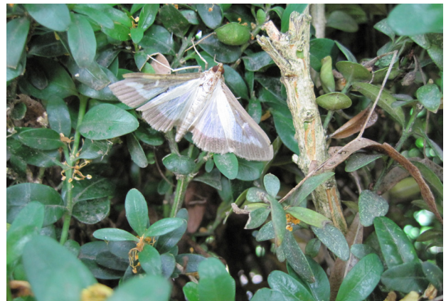
Falter des Buchsbaumzünslers

Da sich die Zulassungen für Pflanzenschutzmittel ändern können, ist stets darauf zu achten, dass das anzuwendende Produkt eine aktuelle Zulassung besitzt.