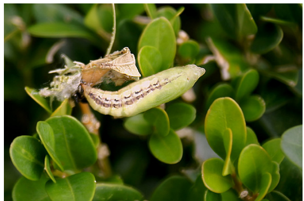
Puppe des Buchsbaumzünslers (typisch ist das Muster an seiner Seite)

Das Raupenstadium dauert im Sommer etwa 4 Wochen. Danach verpuppen sich die Raupen ge-