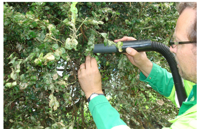
Absaugen der Raupen (Eher bei kleinen Pflanzen realisierbar)