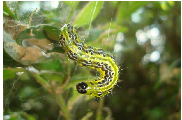
Raupe des Buchsbaumzünslers

Der Buchsbaumzünsler ist je nach Witterungsbedingungen von etwa Anfang April bis Anfang Oktober aktiv. Die Überwinterung erfolgt anscheinend als Raupe gut geschützt in einem Gespinst an den Buchsbaumpflanzen selbst oder an anderen