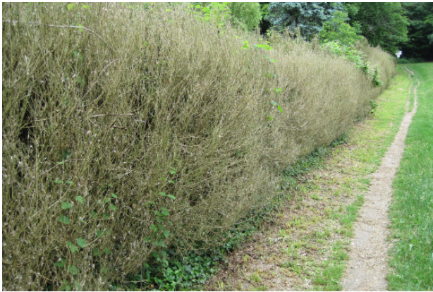
Starke Frassschäden durch den Buchsbaumzünsler