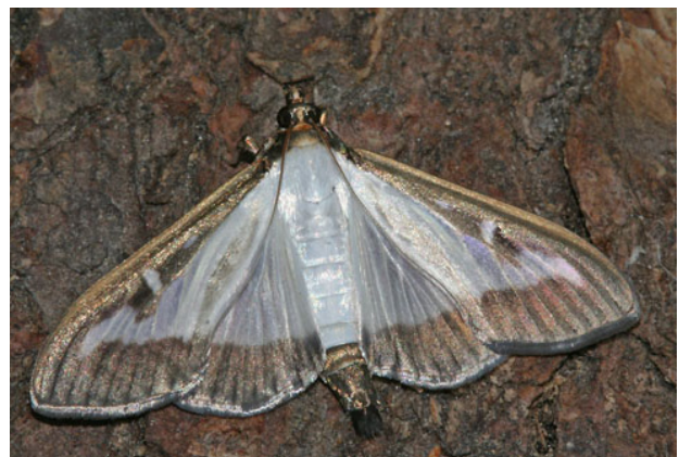
Falter des Buchsbaumzünslers