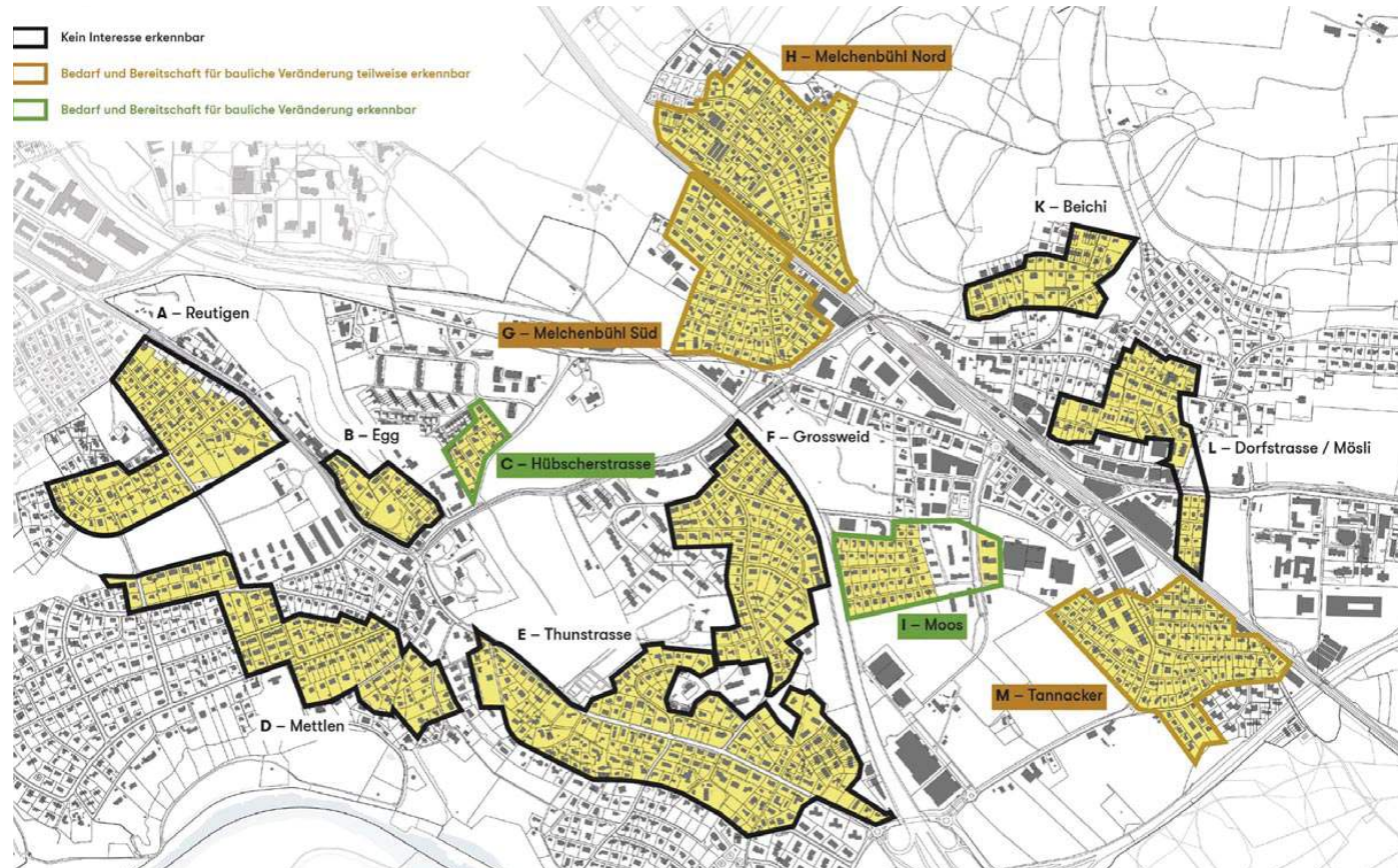
Abbildung: Gebiete/Quartiere mit Ergebnis der Befragung

Der Gemeinderat bleibt also dem differenzierten Vorgehen treu und nimmt – basierend auf den Umfrageergebnissen – in den Gebieten Moos, Melchenbühl Süd und Tannacker nun eine vertiefte Untersuchung vor. Die Analysen dieser drei Quartiere werden auch Rückschlüsse für die Hübscherstrasse und das Melchenbühl Nord ermöglichen. Die Vertiefung umfasst ergebnisoffene Themen wie «Nutzungsreserven», «Anpassung der Grenzabstände» oder «Einfluss qualitätssichernder Vorgaben» (beispielsweise Grünanteil, Versiegelungsgrad Vorzonen, Baulinie). Mit diesem Untersuchungs-Prozess will der Gemeinderat auch sicherstellen, dass er die Quartierstimmen richtig verstanden hat.