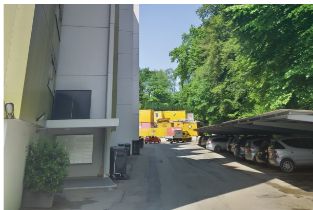
Abbildung: Heutige Situation an der Thunstrasse 9-11 mit Carports direkt auf der statischen Waldgrenze.

Es fragt sich, was im Lichte der heutigen Gesetze ein angemessener Waldabstand ist.