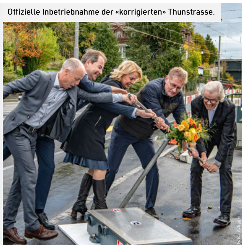
Offizielle Inbetriebnahme der «korrigierten» Thunstrasse.