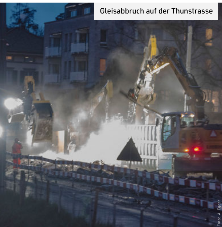
Gleisabbruch auf der Thunstrasse