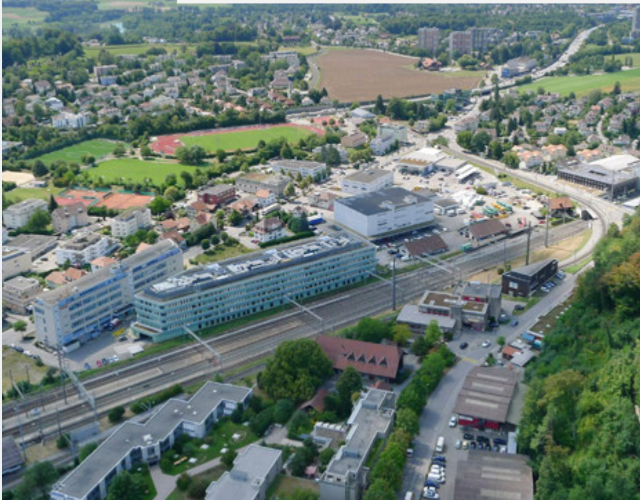
Zentrumsentwicklung Gümligen «Lischenmoos» (ZEG)

Das Bearbeitungsteam konnte den vorhandenen Masterplan verfeinern. An zwei Workshops mit den Fachspezialisten des früheren Beurteilungsgremiums und dem Gestaltungsausschuss Muri bei Bern wurde die ergänzte Planung konsolidiert. An einem sehr gut besuchten Anlass im Juni konnten die Absichten der betroffenen Grundeigentümer in Erfahrung gebracht und in den laufenden Planungsprozess aufgenommen werden.