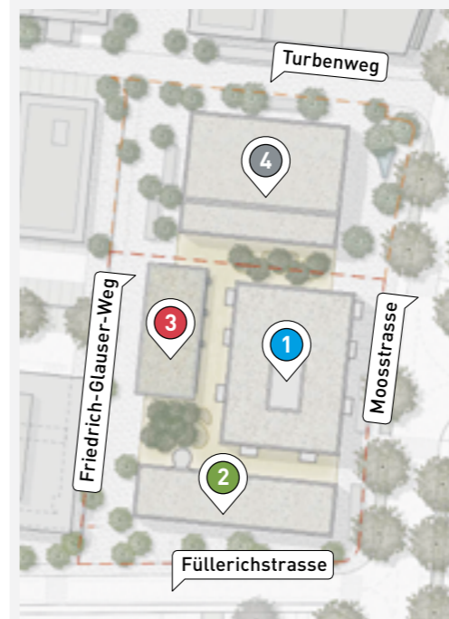
Grafik: Entwicklung Füllerichstrasse- Turbenweg, Gümligen

Am Friedrich-Glauser-Weg, der die Verbindung zum Einkaufszentrum Moos schafft, ist ein einstöckiger Pavillonbau mit öffentlicher Nutzung vorgesehen.